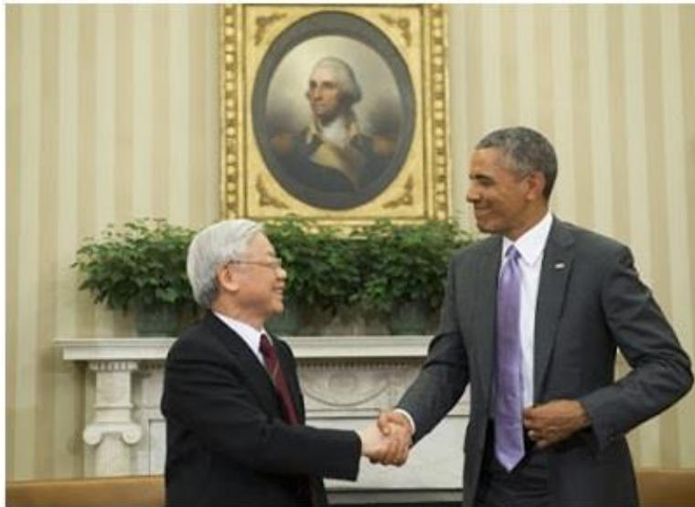
Tổng Bí thư Nguyễn Phú Trọng và Tổng thống Hoa Kỳ Barack Obama tại phòng Bầu dục của Nhà Trắng

Nhận lời mời của Chính quyền Tổng thống Ba-rắc Ô-ba-ma, Tổng Bí thư Ban Chấp hành Trung ương Đảng Cộng sản Việt Nam Nguyễn Phú Trọng đã thăm chính thức Hợp chủng quốc Hoa Kỳ từ ngày 06 - 10/7/2015.